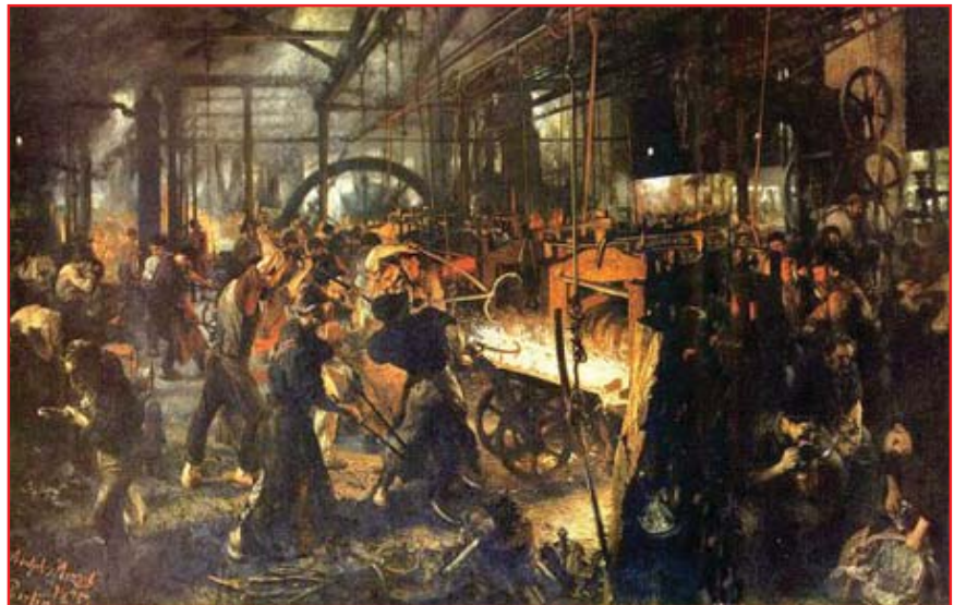
ویژه تولید سرمایه داری به دست تاریخ به زباله دارن نتواهد رفت. (انقلاب اجتماعی لازم است). و اگر سرنگون نشود، میوه نیست که ثوبه بود بگردد، بلکه به بیات بود در هیاتی منط تر ادامه خواهد داد.

بلشویک ها مقوله ی فعلیت انقلاب را بر اساس همین مفهوم از دوران استنتاج می کردند. بر همین اساس بود که کمیتزین اعلام کرد تاریخ وارد «دوران انقلابات کارگری سوسیالیستی» شده است؛ چرا که در دوران انحطاط سرمایه داری، تضاد کار و سرمایه در خود تولید اجتماعی به اوج خود می رسد. بنابراین، اعتقاد داشتند در دورانی به سر می برند که «شرایط عینی» برای انقلاب سوسیالیستی در مقیاس جهانی فراهم شده است. هدف اعلام شده از تشکیل بین الملل سوم، «آماده کردن شرایط ذهنی» برای آن بود. و باز هم بر اساس همین دیدگاه بود که پس از انحطاط بین الملل سوم و تبدیل آن به ابزار سیاست خارجی بوروکراسی حاکم در مسکو، جناح چپ کمیتزین از «فقدان عامل ذهنی» و یا «بحران رهبری پرولتری» صحبت می کرد. باید بررسی کرد این برداشت تا چه اندازه درست بود و امروزه تا چه اندازه کارایی دارد. (۳) اما، درباره ی این نکته نیز در همان نگاه اول به جرات می توان گفت حتا اگر دوران لنین، دوران طفیلی گری سرمایه نبود، مثل روز روشن است که امروزه دیگر چیزی جز این نیست!